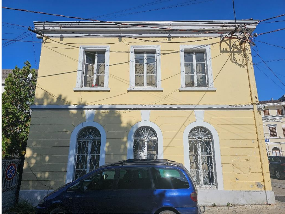
Foto 5. Foto e fasadës anësore