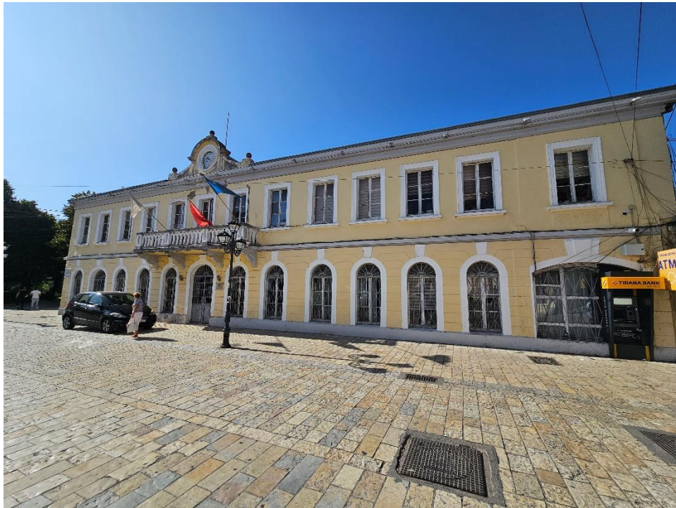
Foto 6. Foto të fasadës