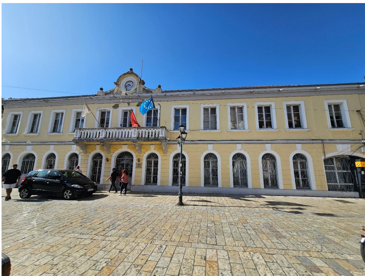
Foto 4. Foto e fasadës kryesore

Projekti i mirëmbajtjes konsiston në heqjen e dritareve të drurit dhe furnizimin e vendosjen e dritareve të reja druri me kase binar tek xham.