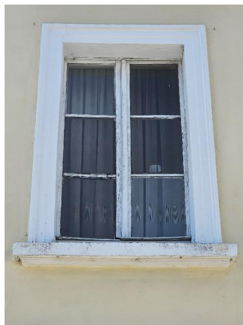
Foto 7,8,9,10. Foto të dritareve ne fasadë