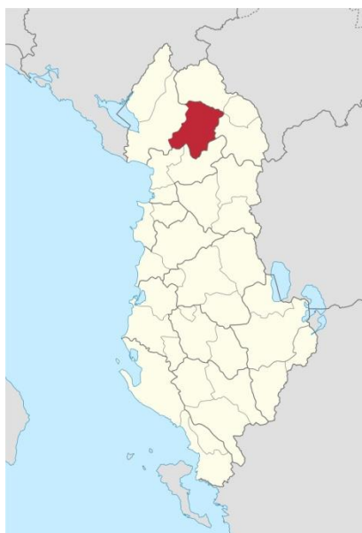
Fig 1. Harta e Shqipërisë, evidentim i qytetit Pukë

Galeria e Arteve, ish Bashkia e qytetit të Shkodrës., ndodhet në qytetin e Shkodrës jo shumë larg nga qendra e qytetit.