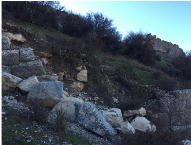
Foto e murit të anës veriore