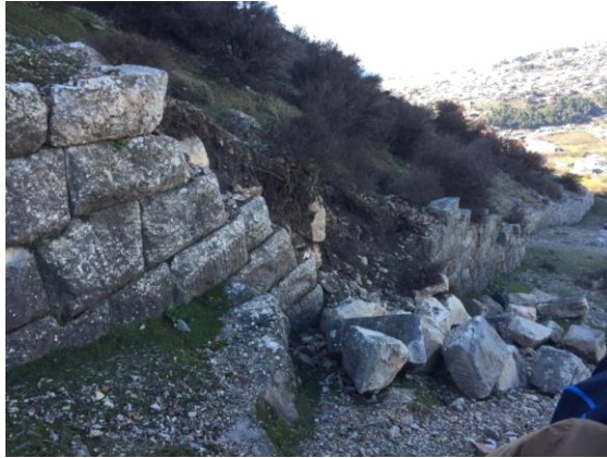
Foto e murit të anës veriore