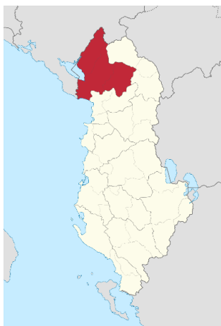
Fig 1. Harta e Shqipërisë, evidentimi i qarkut Shkoder

Muzeu Kombëtar i Fotografisë “Marubi”, ndodhet në qytetin e Shkodrës, në rrugën “Kolë Idromeno”, pjesë e qendrës historike të qytetit Shkodër. Qendra historike e Shkodrës është shpallur e tillë me vendimin Nr. 771 datë 30.09.2020 “PËR DEKLARIMIN PASURI KULTURORE TË “QENDRËS HISTORIKE” TË QYTETIT TË SHKODRËS, PËRCAKTIMIN E ZONËS MBROJTËSE TË SAJ DHE MIRATIMIN E PLANIT PËR RUAJTJEN, MBROJTJEN DHE ADMINISTRIMIN E TYRE”