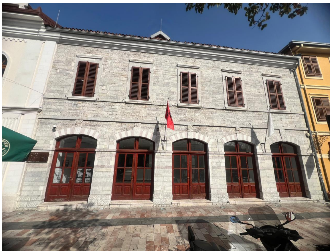
Fig 5. Foto e fasadës së muzeut

Dritaret, dyert dhe grilat kanë përmasat si në projektin teknik dhe skedën e tyre.