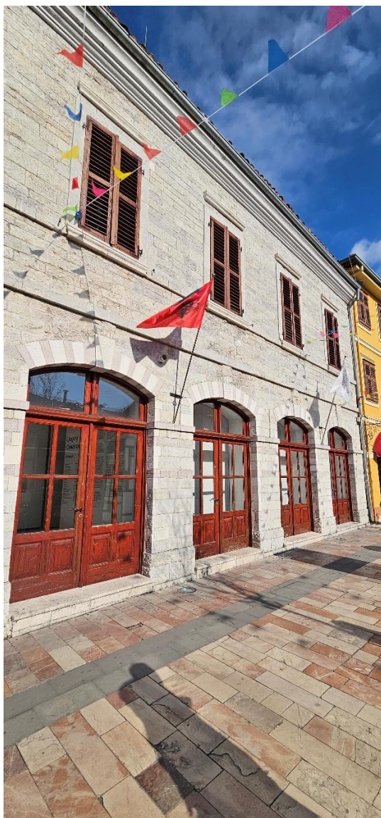
Foto te gjendjes ekzistuese

Duke u nisur nga kërkesa e bërë nga vetë Muzeu Kombëtar, por edhe duke konstatuar si Drejtori Rajonale e Trashëgimisë Kulturore Shkodër, kemi arritur në përfundimin se të gjithë elementët drusorë të fasadës duhen zëvendësuar. Dritaret janë mjaft të amortizuar deri në pikën që një pjesë e tyre nuk hapen fare. Grilat gjithashtu nuk preken pasi janë degraduar. Të njëjtën situatë kemi edhe me dyert e fasadës ku vetëm dera hyrëse është funksionale. Dyert dhe dritaret e fasades jane te gjitha dopio xham.